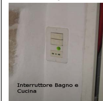
Interruttore Bagno e Cucina